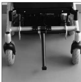
Dispositivo superamento gradini (sali-cordoli) EF07