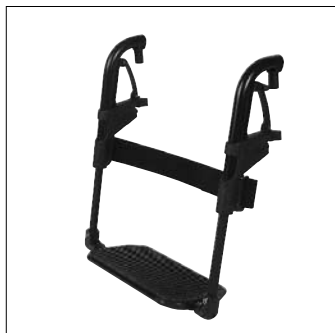
Pedana unica EB03