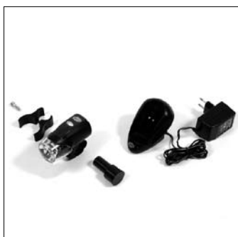
Kit luci supplementari ES25