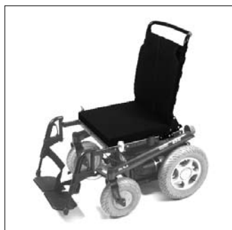
Sedile Standard EC01 e EC02