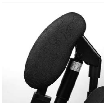
Protezione laterale gambe EB80