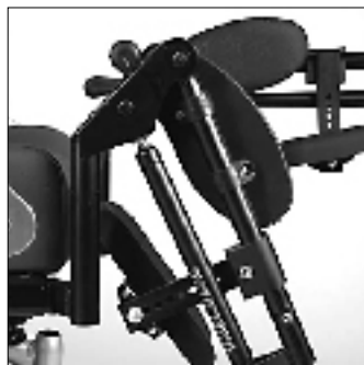
Pedana ad elevazione manuale EB20