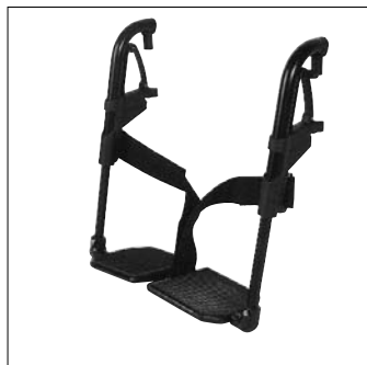
Pedana divisa in alluminio EB02