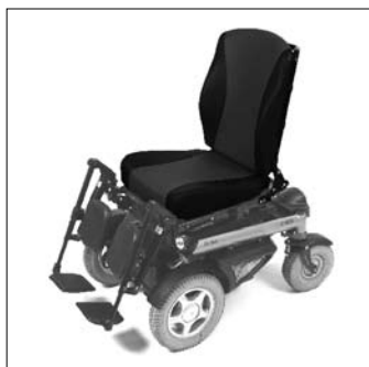
Sedile Contour EC03 e EC04