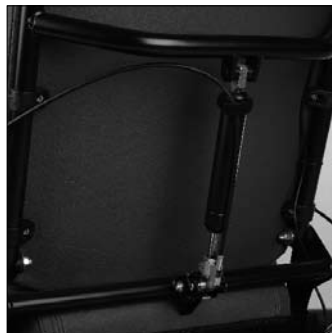
Reclinazione manuale schienale ED20