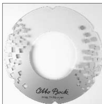
MG 95 Copriraggi "Decor"