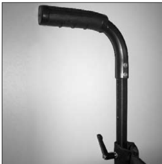
MD 52 Manopole regol.in altezza