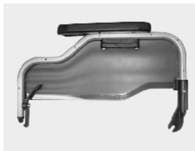
ME 10 Braccioli Transfer