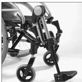
MB 15 Pedane elevabili