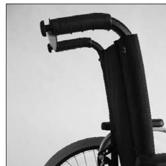
MD 10 Schienale reclinabile 30°