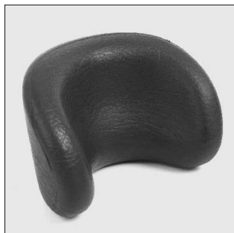
MZ 53 Poggiatesta