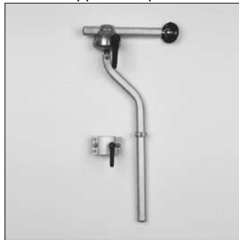
MZ 55 Set montaggio pluriassiale