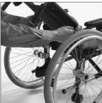
MD 11 Schienale riducibile