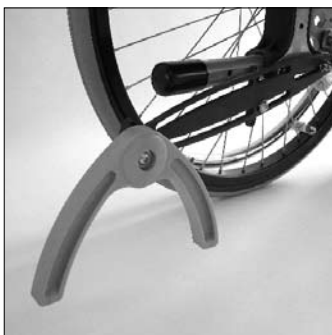
MA 62 Antiribaltam.oscillante