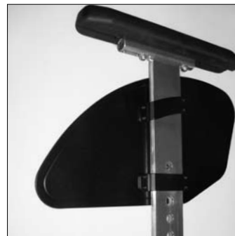
ME 03 Bracciolo estraib c.spondina dritta