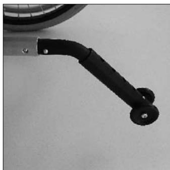
MA 55 Antiribalt. estraib.c.ruotina