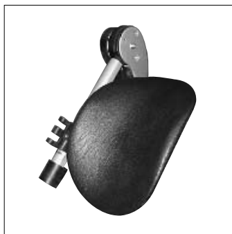
MB 21 Supporto amput.transtibiale