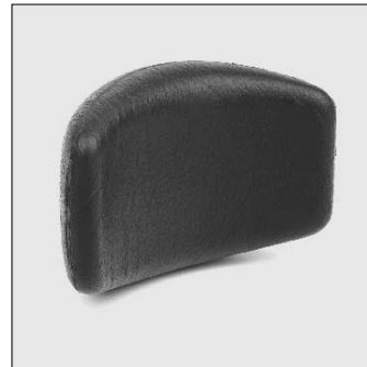
MD 23 Supporto laterale torace